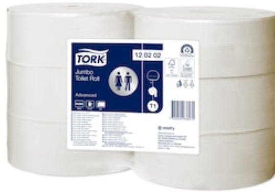
Tork T1 Adv Soft C. ig. Jumbo 280 mt 120202