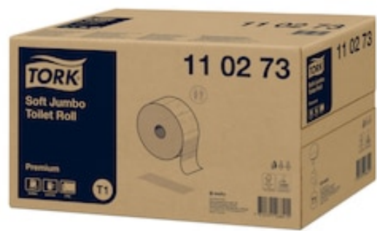
Tork T1 Prem Soft C. ig. Jumbo 360 mt 110273