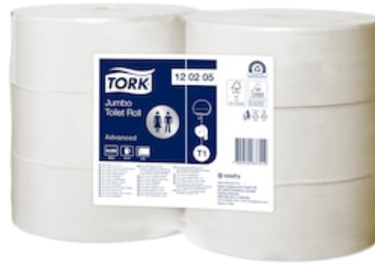
Tork T1 Adv Soft C. ig. Jumbo 360 mt 120205