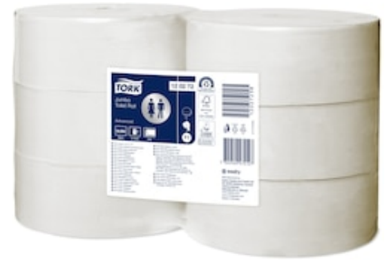
Tork T1 Adv Soft C. ig. Jumbo 360 mt 120272